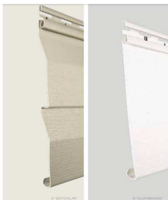
Dutchlap or Clapboard

Material : Double pan 5" Vinyl or aluminum may be used in Painter's Hill