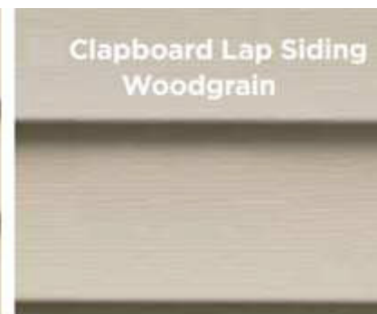
or "Natural Woodgrain"